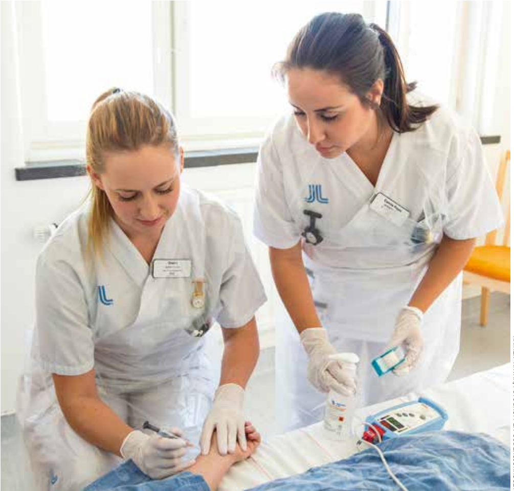
RAINER THIAN/FOTOGROUPEN SÖDERSJUKHUSET